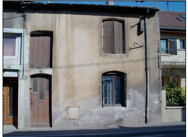
4 : Maison de Vigneron avec gerbière