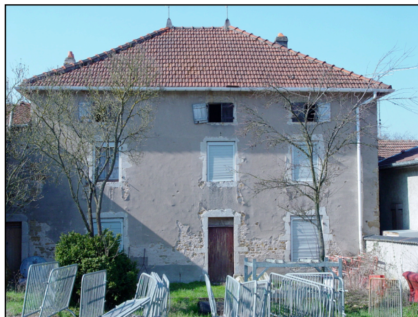
10. Presbytère 19 ème , façade arrière