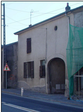
2 : Façade et ouvertures