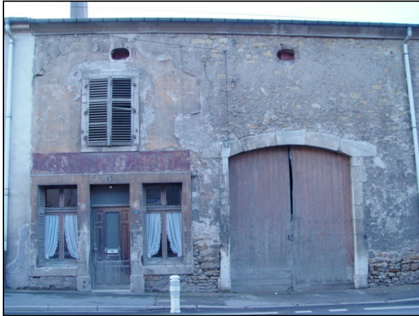
1 : Café fin 19 ème début 20 ème , le cafetier a une double activité agricole, enduit taloché et pigment orangé