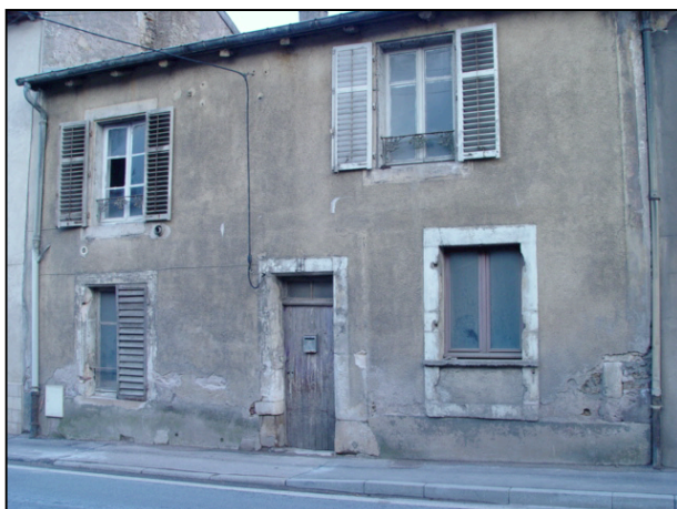
3 : Maison ouvrière à enduit taloché