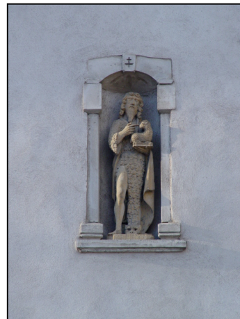
5 : Niche à statuette