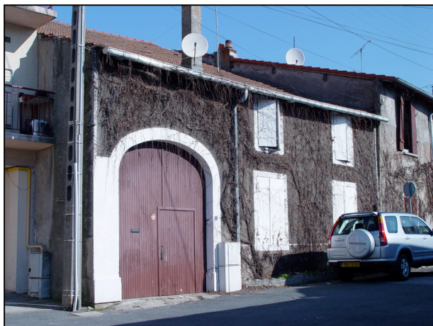
7 : Maison de brassier vigneron, unique entrée par la porte de grange, mi 19ème