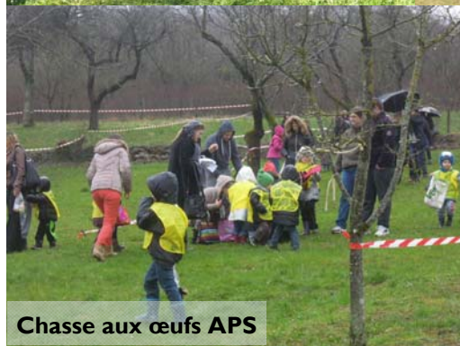
Chasse aux œufs APS