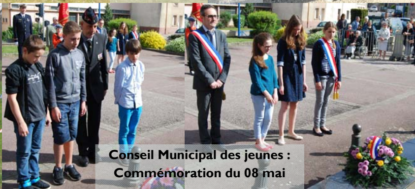
Conseil Municipal des jeunes : Commémoration du 08 mai

Accueil de loisirs du 06 au 31 juillet :