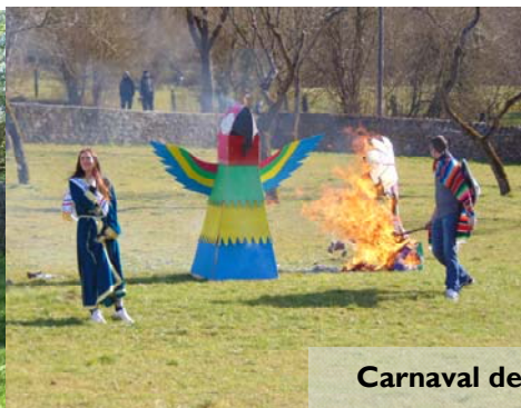
Carnaval des TAP