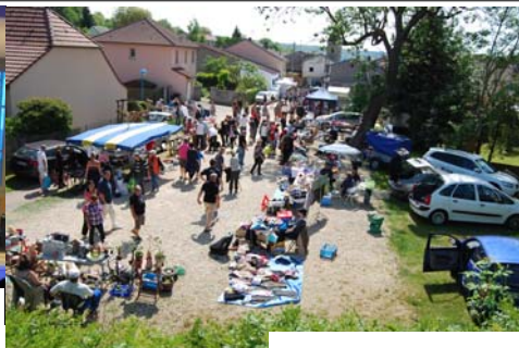
Brocante de Chavigny : Comité des fêtes