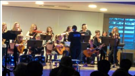
Concert Ecole de Musique Moselle-et-Madon