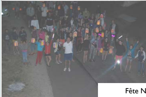
Fête Nationale du 11 juillet : Comité des Fêtes et Municipalité