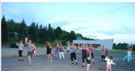
Zumba Party lors du repas de l'APS